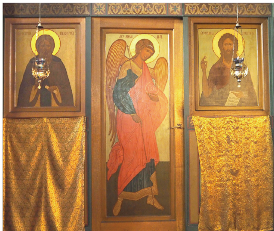
▲北門右起：洗者若翰、天使彌額爾、聖謝爾吉。