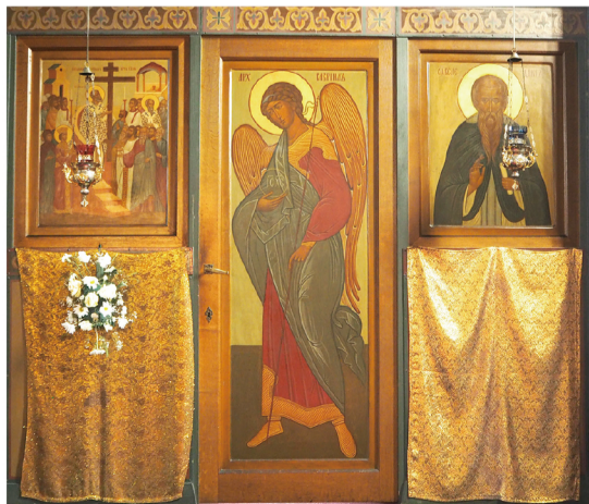
▲南門左起：光榮十字架、天使加俾厄爾、聖本篤。