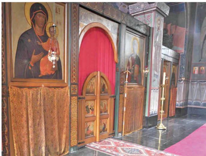
▲聖幃中央的聖門與門簾（取自修道院官網）