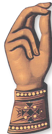
▲拜占庭東方禮的劃十字聖號手勢 ▲身穿黑袍的神父們