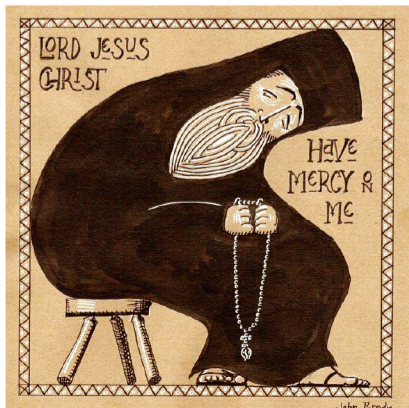
▲〈耶穌聖名禱文〉（John Brady繪）