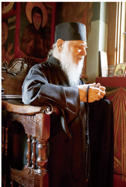
▲東方教會的「靜修」祈禱。

東方基督宗教世界的默禱傳統「靜修」是否與聖本篤及其修會有過東西相遇的機會呢？聖本篤的會規理念不僅根植於東方教父們的教導，更曾與阿陀斯這座聖山上的正教隱修院有過實質上的來往。5世紀時，位於義大利阿瑪菲（Amalfi）的本篤會院派遣隱修士至阿陀斯山上，建立了阿瑪菲同名隱修院（Monastère des Amalfitains de l'Athos），在這修院中循聖本篤會規，以拉丁文為主要的禮儀語言，並與阿陀斯山隱修院的正教隱修士們保持友好的關係，直到1054年東西方教會的正式大決裂（參見系列6）後才日漸荒廢，東西禮儀的相遇也撐到13世紀末才正式終結。到20世紀，雪維凍泥爾修道院數名修士至阿陀斯山隱修院朝聖，見習在阿陀斯山的聖亞大那削（Athanasios l'Athonite，希臘文：Αθανάσιος ο Αθωνίτης）會規下的修道日常，及深度的「靜修」；又再度為早年的東西相遇重啟了希望之門。