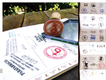
◀圖6：聖本篤朝聖之路的護照及蓋章。