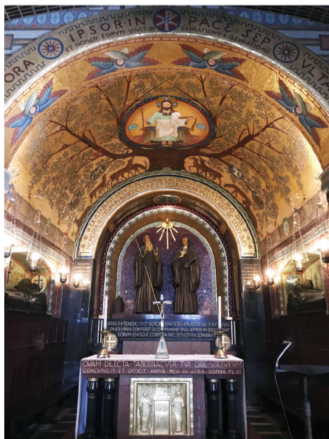
▲圖4：聖本篤及胞妹聖思嘉在卡西諾山修院的墓。