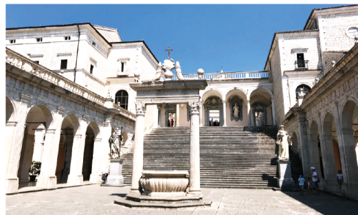
▲圖3：卡西諾山本篤修道院。