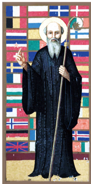
▲圖5：卡西諾山修院的「歐洲主保聖本篤」之馬賽克壁畫。