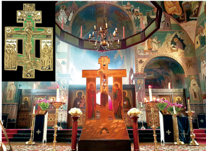
▲圖6：加爾瓦略山的十字架見證。(左上：取自修道院官網；右：聖週五，取自修院官網FB)