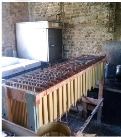
▲圖1：雪維凍泥爾修道院的蠟燭工作坊。