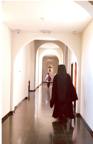
▶圖3：俄羅斯拜占庭禮傳統的十字架聖架。