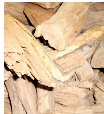
▲圖4：「埃德薩的檀香」乳香。（取自修道院官網）