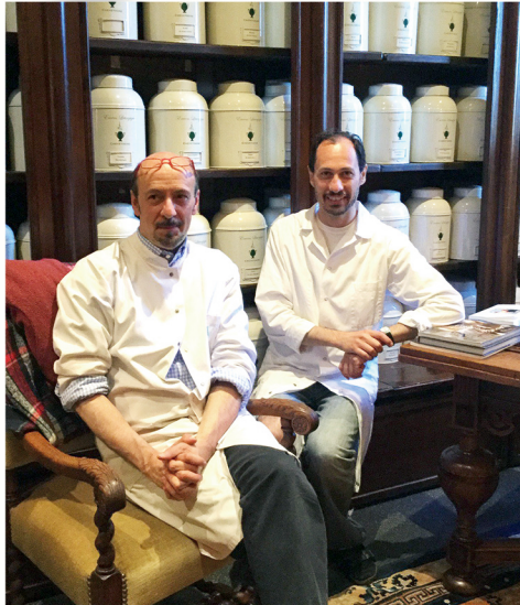
▲圖1：雪維凍泥爾乳香工作坊的主力神父們。

教宗方濟各勉勵我們每天花15分鐘的時間與天主談話、祈禱，很多人做不到，可能是因為沒有從旁協助的工具，好讓心平靜下來；一旦點了乳香，從點燃至燒盡，也不過15至20分鐘的時間，在這段時間中，嗅著芳香的氣息，尤其是點燃有玫瑰香氣的乳香時，更能感受到聖母環抱著我們，等著聆聽我們的祈禱，好為我們向天主代禱。在薰香中默禱，順著乳香冉冉上升的香煙，向天主傾訴我們的祈禱及渴望。