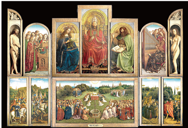
▲圖2〈神秘羔羊之愛〉(取自明信片)