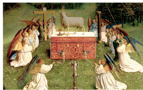
▲圖4〈神秘羔羊之愛〉局部圖