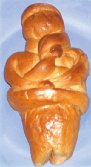
▲圖1：在「拉匝祿星期六」節慶必吃的造型獨特拉匝祿麵包。

概也是我們喜歡購買聖物的原因吧！因為配戴上聖物，總是讓我們感到能與聖人更加靠近。人們尋求一份歸屬的感情，就是這樣透過信友的選擇自然流露。朝聖旅途中，如果在團隊提示各地值得反省的《聖經》經文之外，能安插這些很人性的、結合文化活