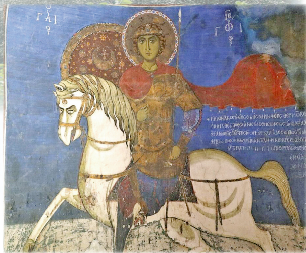
▲圖2：阿西努聖堂的聖喬治畫像，充分表達出他英勇的正義形象。

第3世紀殉道軍人聖喬治的故事，在14世紀《黃金傳奇》這本民間故事集中，蛻變為一位途經一個小國的聖人，他為了拯救城中無數人的生命，特別是那次的犧牲品正是公主，而提出若他屠殺惡龍，整個國家的人便要歸依天主為條