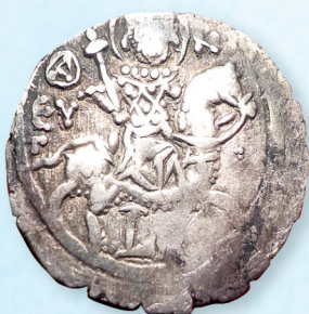
▲▲圖5：騎士聖人與軍裝打扮的國王肖像錢幣正反面。