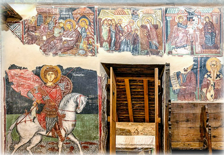
▲圖1：聖彌格聖堂聖喬治的敬禮盛行，聖堂中的聖畫像十分顯著。