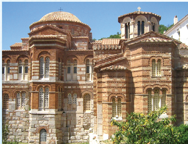
▲圖3：聖路加修道院的建築群，左為大堂（ Katholikon ），右為聖母堂（ Church of Panagia ）。