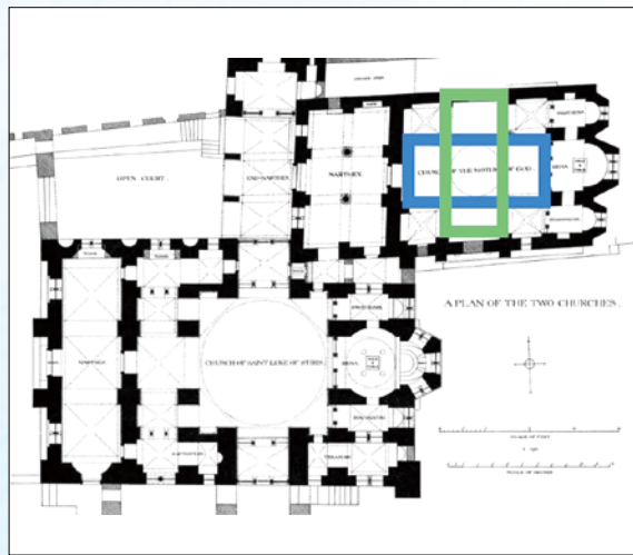
▲圖5：兩座聖堂建築採標準十字方形平面布局，藍、綠矩形交處的中央方形4個角，即是4根柱子的位置。