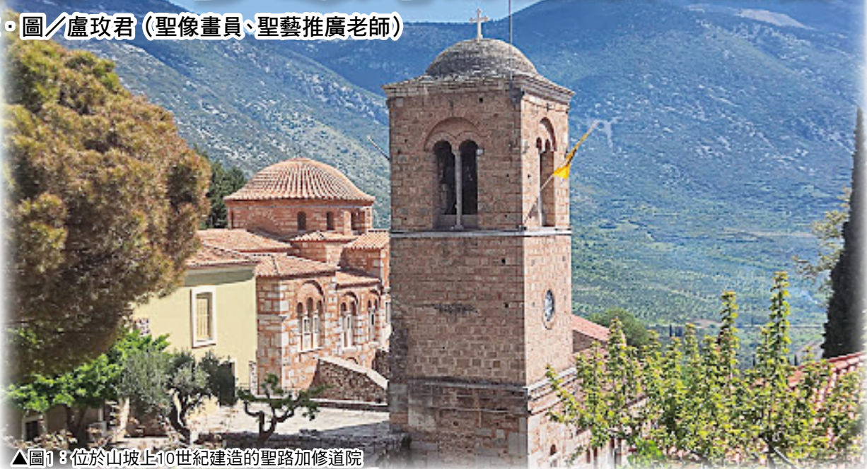
▲圖1：位於山坡上10世紀建造的聖路加修道院