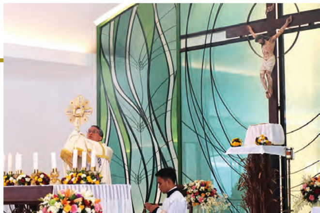
▲2016年，在菲律賓宿霧舉行的第51屆國際聖體大會，大會會場內設有明供聖體聖堂，每小時進行聖體降福。 ▶聖體光座有各種形式，表達基督的救恩和永恆的光芒。