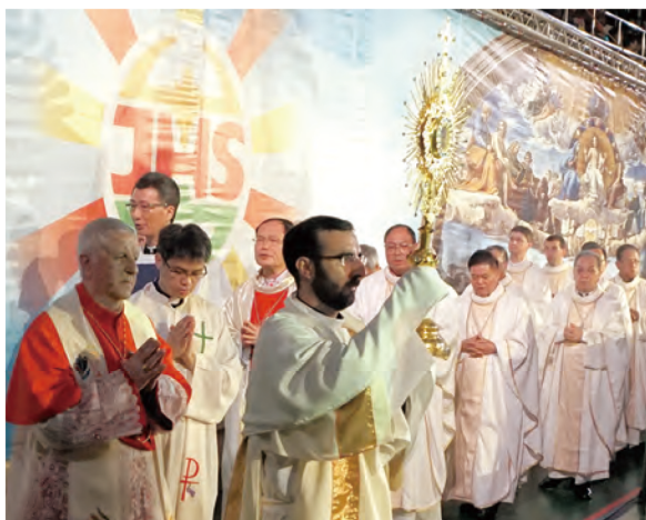
▲2016年全國聖體大會在彰化體育館舉行，聖體遊行在歌聲中，充滿聖神莊嚴、溫馨和諧。

希望透過這深度的愛情交流，分享祂的生命之糧，和祂一起犧牲；飲用祂的聖血，強化彼此的生命盟約，堅定我們的承諾，更加肖似祂，更能活出祂的愛，讓世界因為我們的臨在，而更接近天國。