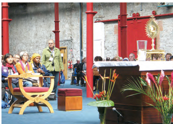
▲2012年在愛爾蘭舉行的第50屆國際聖體大會，闢有敬禮聖體的專屬空間，供人日夜朝拜。