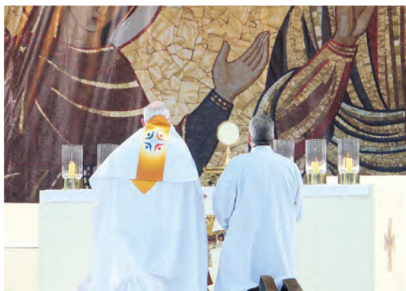
▲2012年國際聖體大會的聖體遊行之前，主禮的樞機主教先行明供聖體祈禱再出發。